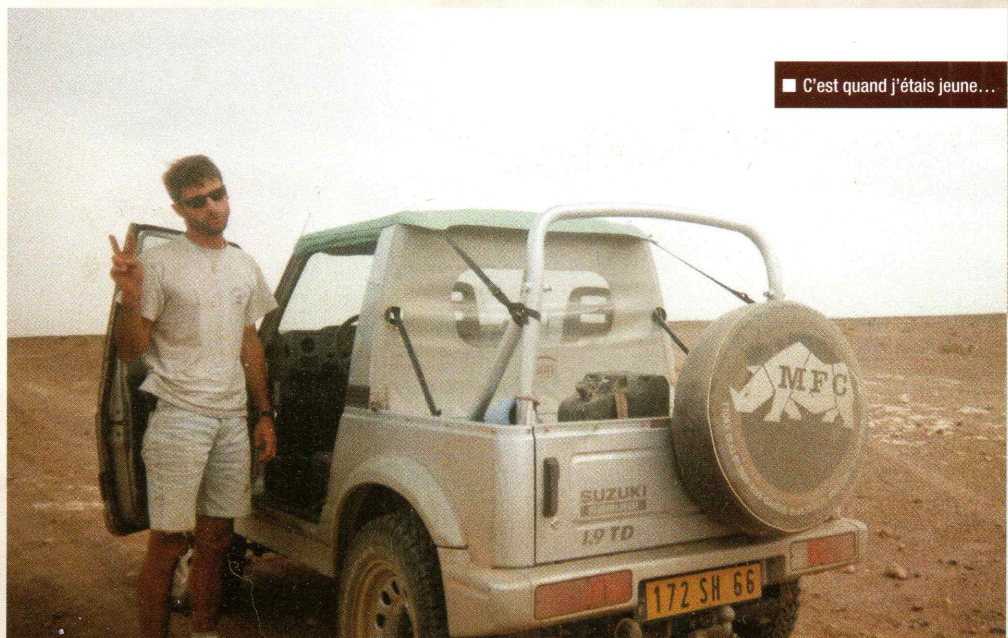
■ C'est quand j'étais jeune...

Actuellement, je voyage avec un Toyota Hilux double cabine de 2014. Je l'ai équipé d'un snorkel, ski de protection